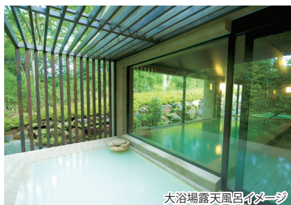
大浴場露天風呂イメージ