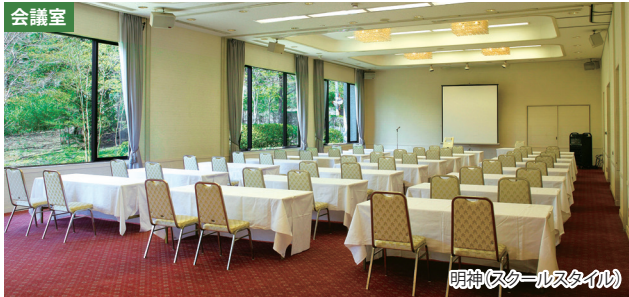
明神(スクールスタイル)