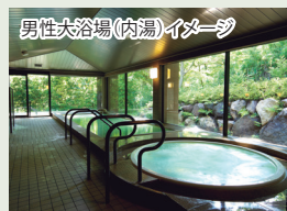
男性大浴場(内湯)イメージ

効能：神経痛、筋肉痛、関節痛、五十肩、運動麻痺、関節のこわばり、うちみ、くじき、慢性消化器病、きりきず、やけど、動脈硬化症