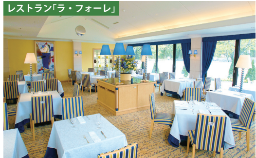
レストラン「ラ・フォーレ」

一面ガラス張りの大きな窓の向こうに自然が広がるレストラン「ラ・フォーレ」は、その味とともに旅情豊かな雰囲気もお楽しみいただけます。