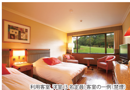
利用客室(洋室(3名定員)客室の一例(禁煙)