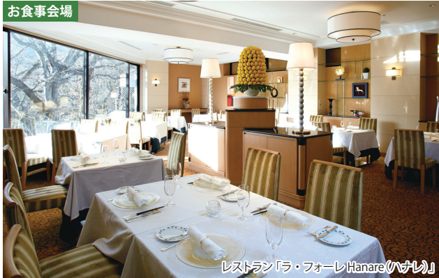
レストラン「ラ・フォーレHanare(ハナレ)」