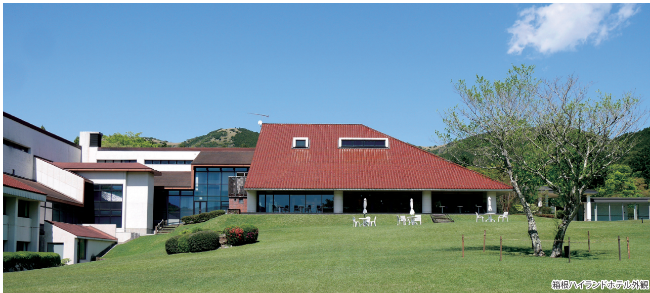
箱根ハイランドホテル外観